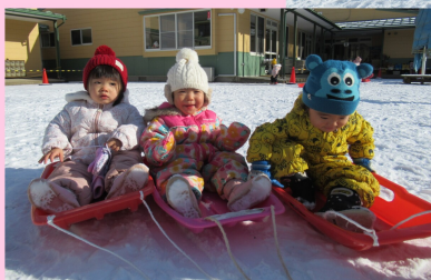
園庭の雪山からそりすべり。大きいクラスの子も小さいクラスの子も「楽しいね!」