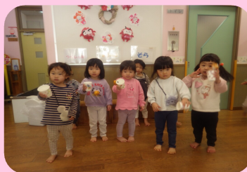
手作りけん玉。上手でしょ! そら組