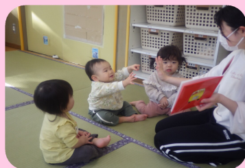
新年初絵本! 「おでかけばいばい」「タッチ」 つくしんぼ組