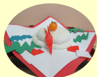
お餅をついて鏡もちづくり。たいよう組の出番です。鏡もちの由来も調べみんなにおしえてくれました。