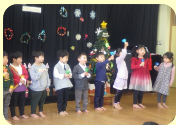
クリスマス会。キャンドルサービスやみんなでお出し物をして楽しんでいると...風の子保育園にプレゼントを届けてサンタさんが!!