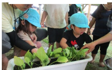
給食さんが育てたハウレンソウ。そらさんも初めて収穫したよ！ -2歳児