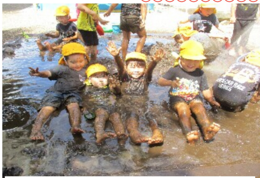
-新しいどろんこ池で思い切り泥遊び！-3歳児