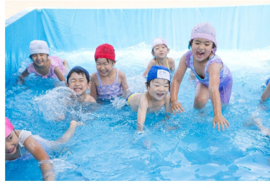
プール遊び。キラキラの笑顔で-4歳児