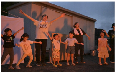
つばさの日キャンプファイヤー、楽しかった！-4歳児