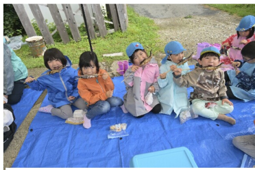
キャンプでイワナつかみ。みんなで命をいただきます！-5歳児

先日行われた保育合研の記念講演で、フォトジャーナリストの安田菜津紀さんは「皆さんは、子どもたちに平和をどうやって説明しますか」と問いかけ、未だに戦争が続くシリア、ウクライナ、パレスチナ自治区ガザで暮らす人々の