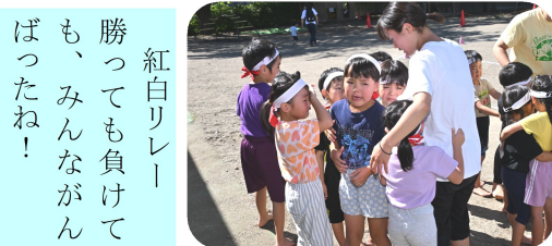
紅白リレー 勝っても負けても、みんながんばったね!