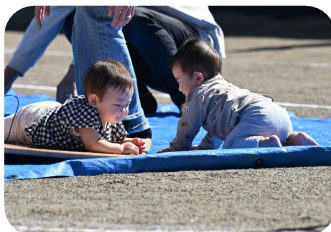
つくしんぼ組 「いいものみつけたよ〜」 「みせて、みせて!!!」