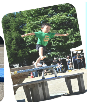
かえるジャンプ だ!ぴよ〜ん!