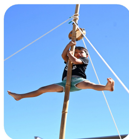
つばさ組 たけのぼり。てっぺんまで登ったら、足はなしの技!