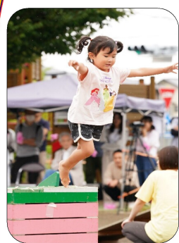
3歳児：くるりんこの後は、大好きなジャンプ! さあ!ウヒアハもやっけるぞ!