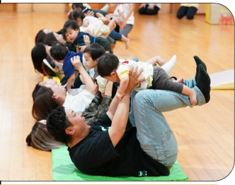
0歳児：お家の人と飛行機ブンブン