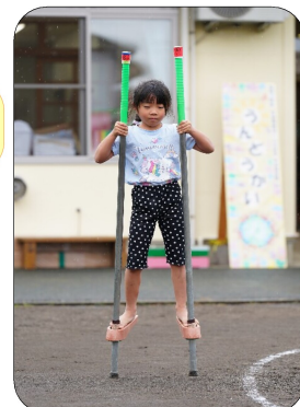
5歳児：竹馬に挑戦! 技も極めます!