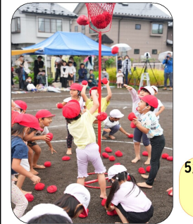
リベンジ運動会紅白玉入れ