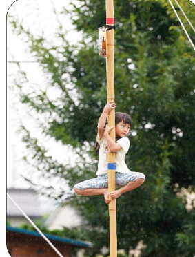
4歳児：足の裏に力を入れて!自分の体をしっかり支えて登ります