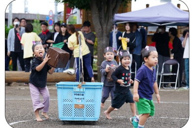
2歳児：おむしばきんだ!虫歯にするぞ