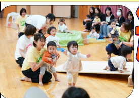
0歳児：ハイハイで板登り自分の足でしっかり歩きます