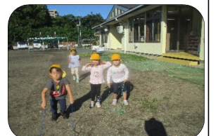
4歳児：運動会でもらった縄跳び！さっそく挑戦！