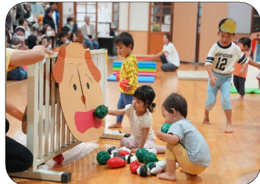
1歳児：おなかすいたの?これ食べて