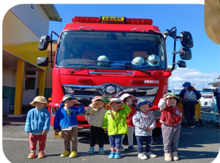
憧れの消防車のまえて敬礼! そら組