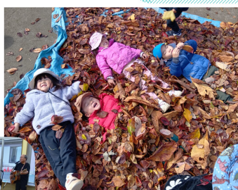
落ち葉のお布団気持ちいいね