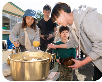
大きなお鍋で熱々のせんべい汁。おかわりもたくさんしました。

り早い時間に出発し満喫しました。どのクラスも保護者同士の交流も深めながら秋を感じることができました。昼食は、給食さん特製せんべい汁。作った分すべて完売！食後の親子製作（レク係主催）では、オリジナルティあふれる作品ができあがり、親子で楽しい時間を過ごしました。当日までの準備や進行等、係の皆さんありがとうございました。松園いいよね！