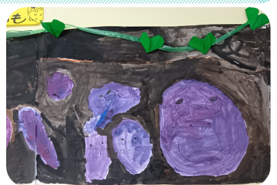
大きな大きなおいも! つばさ