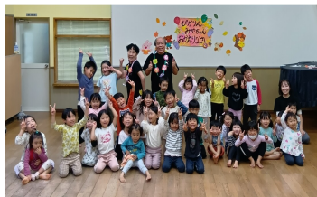
今年もびかりんとみやちゃんか帰ってきてくれました!

現在の生活にとってスマホは不可欠なものとなっていますが、デメリットも多く、これからどう付き合っていくのか、子どもの使用に対してどのように考えるのが重要です。保育園では五感を育む活動をたくさんしています。スマホ以外の楽しさと出会う経験、スマホのない時間を親子でいっしょに楽しむことがお家でもできるとよいですね。そこで、保育園の絵本の貸し出しを再開しました。毎週月・水曜日が貸し出し日。返却は借りた日の2日後。親子でゆったり絵本の時間を楽しんでみてはいかがでしょうか。