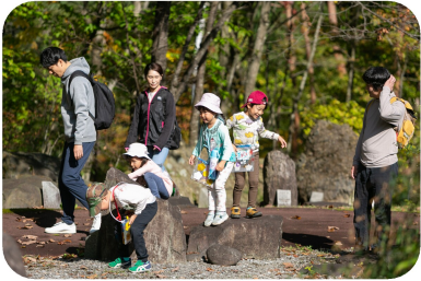
博物館でひと遊び！

先日行われた秋の歩こう会。参加の保護者の皆さんにもクマ対策を講じてもらいながらお天気の中無事開催することができました。小さいクラスは、園周辺をゆっくりと歩いてお散歩。かくれんぼをしたりごっこあそびをしたり親子でたっぷり楽しみました。そら・ひかり組は、せせらぎ緑地まででかけいろいろな木の実を見つけ、自然の宝物を集めていました。つばさ・たいよう組は、博物館へ。大人には長い距離でしたが、子どもたちにとっては日常の散歩コース。ちよっぴ