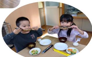
サンマ焼き会。炭火で焼いて丸ごと一匹味わいました