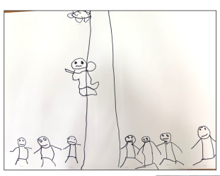
てっぺんまでいけてうれしかった。つばさ組