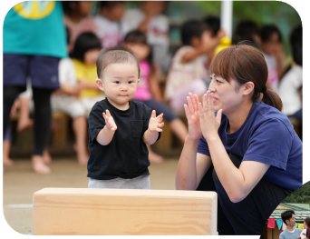
運動会初デビュー! つくしんぼ組