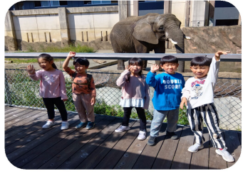
姫神登山は中止になりましたが、路線バスの旅。動物公園へ行ってきました! たいよう組