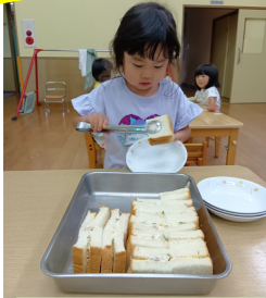
トングで自分で盛り付け 上手でしょ!ひかり組