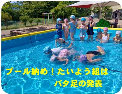
プール納め!たいよう組は バタ足の発表

一人がその子らしさを発揮し、輝く運動会にしたいと思えます。子どもたちの成長を共に喜び合いましょ。