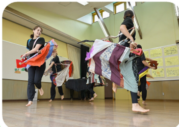
先生たちの荒馬。カッコイイ!

平和の集いでは、絵本を読み、「戦争はだめだね。」「いのちってとっても大事なよね。」と、真剣に話していた年長児。最後は、みんなで平和の歌をうたいました。平和がいいね。