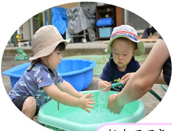
お水でてきたね!ふしぎ?! つくしんぼちゃん

※今年度の運動会は、各家庭3名までとさせていただきます。保護者競技、4.5歳児祖父母競技検討中! 詳しくは後日連絡します。