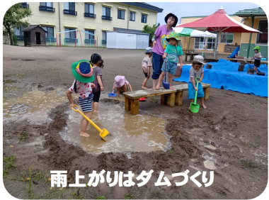
雨上がりはダムづくり