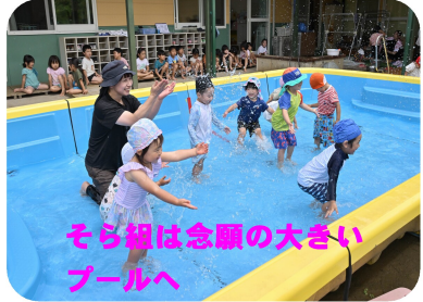
そら組は念願の大きい プールへ