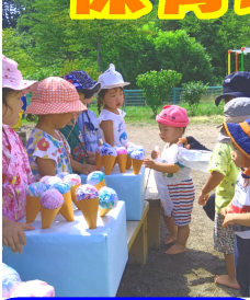
「アイスください!」 「ピーぞ」夏まつり