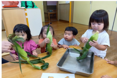
すぎのこ組も皮むきやってみよう!