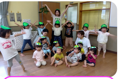
すぎのこちゃんつばさ組のかっぱ兄弟たち。「カッパ〜」