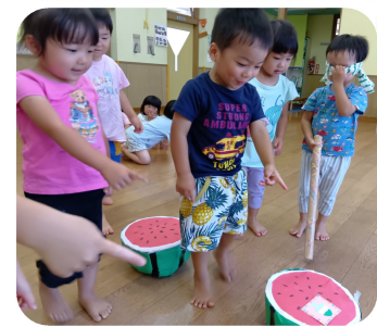
スイカわりごっこ。中からかき氷の券が!!!