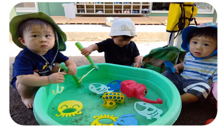
つくしんぼちゃんも「お水気持ちいいね」