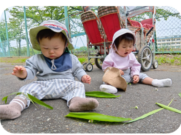
お散歩先で、下に降りてみたよ。葉っぱ発見! つくしんぼ組