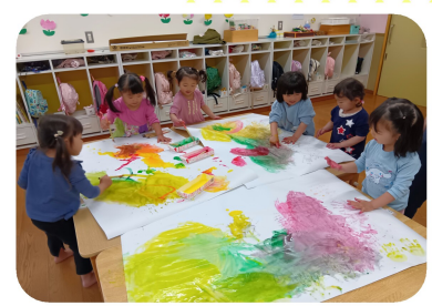
野菜の看板づくり。ラディッシュの赤、パプリカの緑...ハンドペイントでダイナミックに作成中。ひかり組