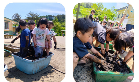
大きなタライとバケツでお米作り。手と足を使って代掻きです。たいよう組