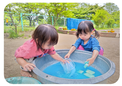
ぶどうジュース出来上がり。カップですくって、「ハイ ドーゾ。」すぎのこ組